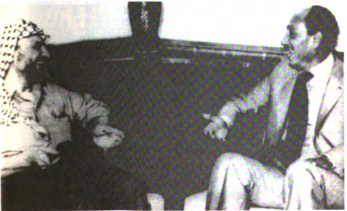
مع الرئيس المصري محمد أنور السادات